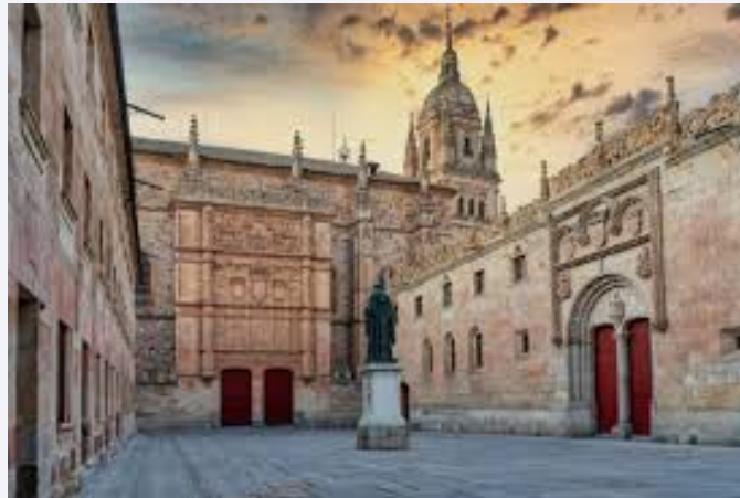
La Universidad de Salamanca

Es una de las plazas más hermosas España