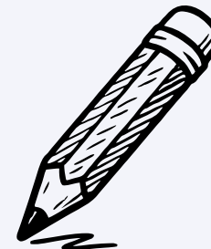
Miguel de Unamuno