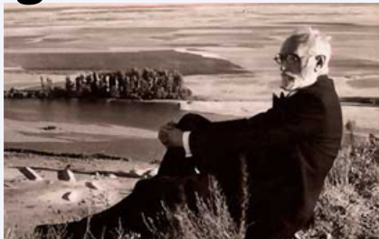
Fray Luis de León